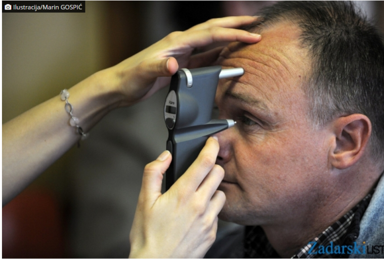
Provodi se projekt za prevenciju glaukoma